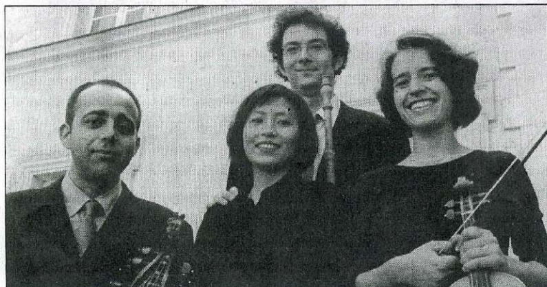
Das Ensemble L'Assemblée des Honnestes Curieux wird am Sonntag in einer Woche das Abschlusskonzert bestreiten.

Schloss Greyerz, So., 27. August, bis So., 3. September, jeweils 9 bis 18 Uhr. Das genaue Konzertprogramm findet sich im Internet unter www.anselmus.ch .