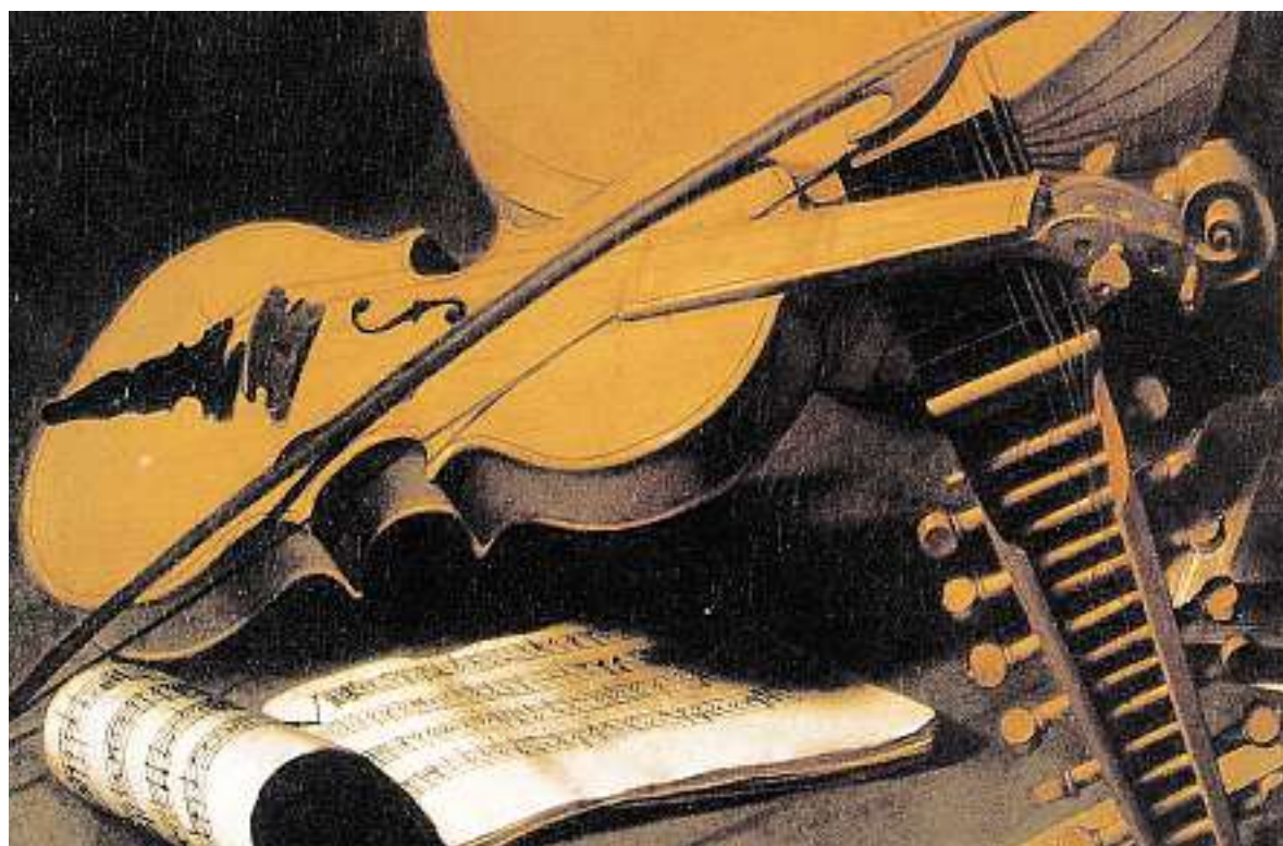
Extrait du tableau «Amor Vincit Omnia» («L'Amour victorieux»), de Michelangelo Merisi da Caravaggio.

Concerts, stages et conférences auront lieu dans le cadre du 4 e atelier de musique ancienne à Gruyères, du 27 août au 3 septembre.