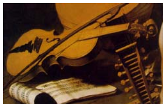
Caravaggio, Amor Vincit Omnia (détail), c. 1601-02

L'Atelier 2006 sera baroque . Au programme, divers concerts de musique baroque par des ensembles internationaux réputés et construction d'instruments dans l'atelier de lutherie : deux violons baroques verront le jour, destinés aux élèves de la Haute Ecole de Musique et du Conservatoire de musique de Fribourg, et une présentation d'archets aura lieu.