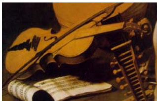
Caravaggio, Amor Vincit Omnia (détail), c. 1601-02

Das Atelier 2006 wird dem Barock gewidmet sein. Auf dem Programm, stehen verschiedene Barockmusik Konzerte von berühmten internationalen Ensembles und der Bau von zwei barocken Geigen , die für das Konservatorium Freiburg (CH) und seine Musikhochschule bestimmt sind. Eine Bogen Vorführung wird ebenfalls stattfinden.