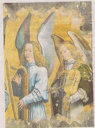
Wichtig in der Renaissance: die Harfe (H. Memling, 1480).